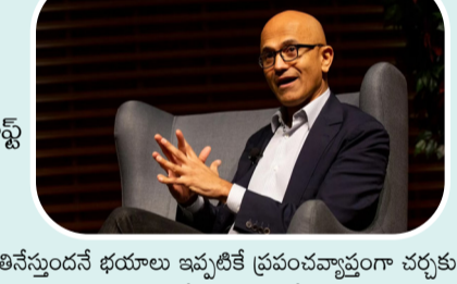
కృత్రిమ మేధ (ఏఐ) మనుషుల ఉద్యోగాలను తినేస్తుందనే భయాలు ఇప్పటికే ప్రపంచవ్యాప్తంగా చర్చకు దారితీస్తున్నాయి. అయితే మైక్రోసాఫ్ట్ సీఈఓ సత్య నాదెళ్ల మరొక అంశాన్ని వ్యక్తం చేస్తున్నారు. ఏఐ వల్ల సృష్టించే విలువ, సంపద, జ్ఞానం అన్నీ కొద్ది కాలంలోనే కేంద్రీకృతమైతే విగతా 2లో