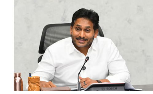
పార్టీ సీనియర్ నాయకులతో వైఎస్సార్ సీపీ అధినేత, మాజీ ముఖ్యమంత్రి వైఎస్ జగన్ మోహన్ రెడ్డి భేటీ అయ్యారు. 'సర్' జరుగుతున్న తీరు, ఆక్రమాలపై చర్చించారు. ఈ సందర్భంగా వైఎస్ జగన్ మాట్లాడుతూ.. విగతా 2లో