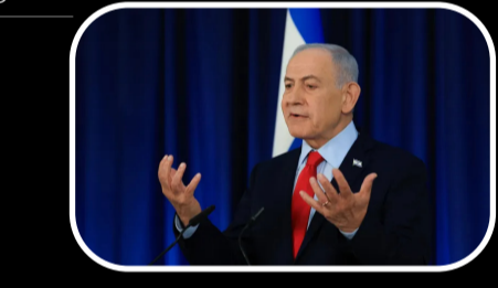
అమెరికా, ఇరాన్ దేశాల మధ్య కుదిరిన చారిత్రాత్మక దౌత్యపరమైన శాంతి ఒప్పందంపై ఇజ్రాయెల్ తీవ్ర అసంతృప్తి వ్యక్తం చేసింది. పశ్చిమ ఆసియాలో యుద్ధ వాతావరణాన్ని విగతా 2లో