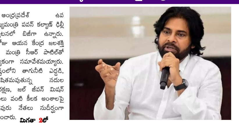
ఆంధ్రప్రదేశ్ ఉప ముఖ్యమంత్రి పవన్ కల్యాణ్ ఢిల్లీ పర్యటనలో బీజేపీ ఉన్నారు. ఈలోజ ఆయన కేంద్ర జలశక్తి శాఖ మంత్రి సీఆర్ పాటీల్ తో ప్రత్యేకంగా సమావేశమయ్యారు. రాష్ట్రంలోని తాగునీటి ఎద్దడి, కలుషితమవుతున్న నదుల వరకక్షణ, జల్ జీవన్ మిషన్ అమలు వంటి కీలక అంశాలపై జరుపుకున్న నేతల సుదీర్ఘంగా చర్చించారు. విగతా 2లో

కేంద్ర జలశక్తి మంత్రితో పవన్ భేటీ.. 'సూరత్ నమూనా'పై కీలక చర్చ! మహిళల దుస్తులు, రూపంపై వ్యాఖ్యలు అవమానకరం రాజకీయ విమర్శలు విధానాలపై మాత్రమే ఉండాలి