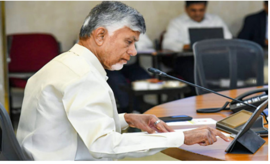
అమరావతి: ఏపీకి పెట్టుబడులను ఆకర్షించడమే లక్ష్యంగా సీఎం చంద్రబాబు సింగపూర్ లో పర్యటించనున్నారు. జూన్ 14 నుంచి సోగ్ ఈ పర్యటనలో రాష్ట్రానికి, ముఖ్యంగా రాజధాని