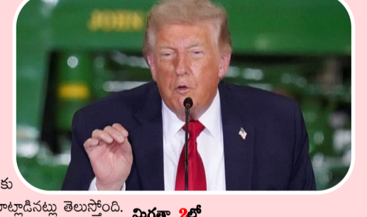
ఇరాన్ తో కొనసాగుతున్న ఉద్రిక్తతలకు త్వరలోనే తెరపడే అవకాశం కనిపిస్తోంది. ఈ మేరకు అమెరికా అధ్యక్షుడు డొనాల్డ్ ట్రంప్.. ఇజ్రాయెల్ ప్రధాని బెంజమిన్ నెతన్యాహుతో ఫోన్ లో మాట్లాడినట్లు తెలుస్తోంది. మిగతా 2లో