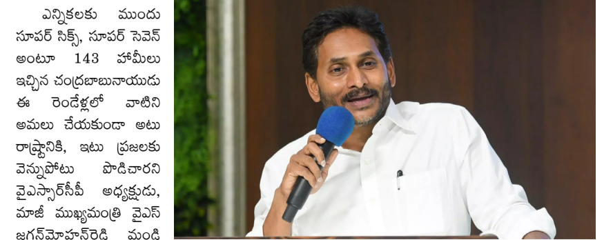
ఎన్నికలకు ముందు సూపర్ సిక్స్, సూపర్ సెవెన్ అంటూ 143 హామీలు ఇచ్చిన చంద్రబాబునాయుడు ఈ రెండేళ్లలో వాటిని అమలు చేయకుండా అటు రాష్ట్రానికి, ఇటు ప్రజలకు వెన్నుపోటు పొడిచారని వైఎస్సార్ సీపీ అధ్యక్షుడు, మాజీ ముఖ్యమంత్రి వైఎస్ జగన్మోహన్ రెడ్డి మండి పడ్డారు. రెండేళ్ల నారాసుర పాలన రాష్ట్రానికి, రాగానే ఇచ్చిన హామీలన్నీ నెరవేరుస్తామని ఇండిండిక్ బాండ్లు రాసిచ్చి పరీ మిగతా 2లో

రెడ్ డబ్బు రాజ్యాంగంతో రాష్ట్రాన్ని జంగిల్ రాజ్ గా మార్చారు చెప్పిన మాటలకు.. చేసిన పనులకు ఏమాత్రం పొంతనే లేదు సూపర్ సిక్స్.. సూపర్ సెవెన్ సహా 143 హామీలిచ్చారు