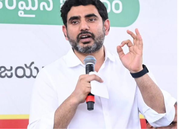
మంత్రి లోకేశ్ ముఖ్య అతిథిగా పాల్గొన్నారు. ఈ సందర్భంగా మంత్రి మాట్లాడుతూ.. మిగతా 2లో

విశాఖవల్లం: వికసిత భారత్ నిర్మాణమే మన లక్ష్యం. నైపుణ్యం కలిగిన మానవ వనరులతోనే పోటీ సామర్థ్యం పెరుగుతుంది. సుసంపన్న భవిష్యత్ కోసం మానవ వనరులపై పెట్టుబడి పెట్టాలని విద్య, ఐటీ శాఖల మంత్రి నారా లోకేశ్ పేర్కొన్నారు. రాష్ట్రంలో ఉన్నత విద్య, డిజిటల్ పరివర్తన, ఆధునిక సాంకేతికత అంశాలపై విశాఖలోని రాడిసన్ బిల్డింగ్ లో జరిగిన 'డీజీ 100ఎక్స్ ఏపీ' సదస్సు ముగింపు కార్యక్రమంలో