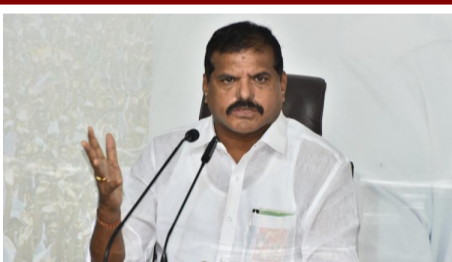
విశాఖ స్టీల్ ప్లాంట్ ఘోర ప్రమాదంలో గాయపడి కేకపాడే ఆసుపత్రిలో చికిత్స పొందుతున్న మిగతా 2లో