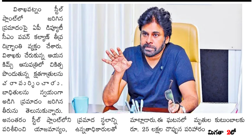
విశాఖపట్టణం స్టీల్ ప్లాంట్లో జరిగిన ప్రమాదంపై ఏపీ డిప్యూటీ సీఎం పవన్ కల్యాణ్ తీవ్ర దిగ్బంధి వ్యక్తం చేశారు. విశాఖకు చేరుకున్న ఆయన కిమ్స్ ఆసుపత్రిలో చికిత్స పొందుతున్న క్షతగాత్రులను వ రా మం ర్మిం లా రం . బాధితులను స్వయంగా ఆడిగి ప్రమాదం జరిగిన తీరును తెలుసుకున్నారు. అనంతరం స్టీల్ ప్లాంట్లోని ప్రమాద స్థలాన్ని మాట్లాడుతూ ఈ ఘటనలో మృతుల కుటుంబాలకు రూ. 25 లక్షల చొప్పున పరిహారం మిగతా 2లో

విశాఖ స్టీల్ ప్లాంట్ ప్రమాద స్థలాన్ని పవన్ పరిశీలన కిమ్స్ ఆసుపత్రిలో క్షతగాత్రులను పరామర్శించిన డిప్యూటీ సీఎం