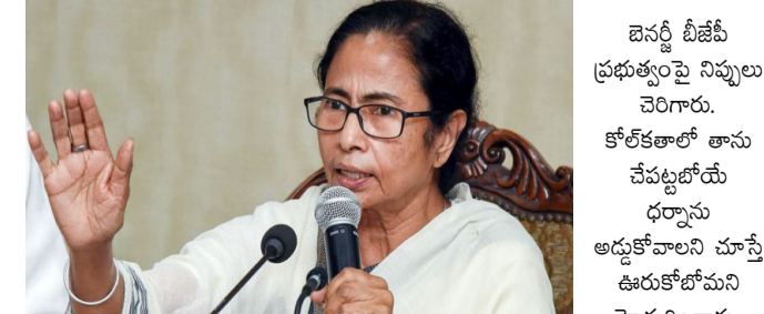
పశ్చిమ బెంగాల్: పశ్చిమ బెంగాల్ మాజీ ముఖ్యమంత్రి, తృణమూలీ కాంగ్రెస్ అధినేత్రి మమతా ధైర్యముంటే నన్ను అరెస్ట్ చేసుకోండి అంటూ పోలీసులకు బహిరంగంగా సవాల్ విసిరారు. మిగతా 2 లో

"ధైర్యముంటే నన్ను అరెస్ట్ చేసుకోండి".. ధర్మాకు అనుమతి నిరాకరణపై మమతా బెనర్జీ ఫైర్! కోల్ కతాలో ధర్మాకు పిలుపునిచ్చిన మమతా బెనర్జీ ధర్మాకు అనుమతి నిరాకరించిన పోలీసులు అనుమతి ఇవ్వకపోయినా ధర్మా నిర్వహిస్తామన్న మమత