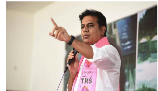
దినోత్సవాన్ని పురస్కరించుకుని టీఆర్ఎస్ వర్కౌగ్ ప్రెసిడెంట్ కేటీఆర్ రాష్ట్ర ప్రజలకు మిగతా 2 లో

తెలంగాణ ప్రగతి, ప్రజల సంక్షేమనే లక్ష్యంగా జిఆర్ఎస్ పని చేసిందని వ్యాఖ్య తెలంగాణ అస్తిత్వానికి రక్షణ కవచంలా నిలబడిందన్న కేటీఆర్ హైదరాబాద్: తెలంగాణ రాష్ట్ర 12వ ఆవిర్భావ