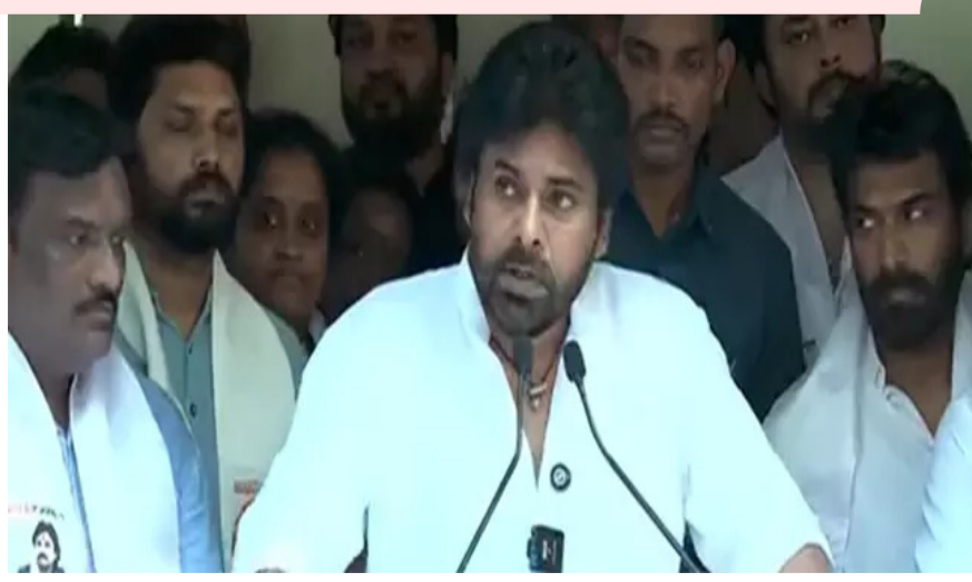
హైదరాబాద్: "ఇప్పటి వరకు నిర్ణయించుకోలేదు. మీరు అంటున్నారు గనక చెబుతున్నా తెలంగాణలో జనసేన ఉంటుంది. మేం ఇక్కడ పోటీ చేస్తాం. అవసరమైతే తెలంగాణలో నేనే తిరుగుతాను. మేమే తిరుగుతాం. మిగతా 2 లో

"ధైర్యముంటే నన్ను అరెస్ట్ చేసుకోండి".. ధర్మాకు అనుమతి నిరాకరణపై మమతా బెనర్జీ ఫైర్! కోల్ కతాలో ధర్మాకు పిలుపునిచ్చిన మమతా బెనర్జీ ధర్మాకు అనుమతి నిరాకరించిన పోలీసులు అనుమతి ఇవ్వకపోయినా ధర్మా నిర్వహిస్తామన్న మమత