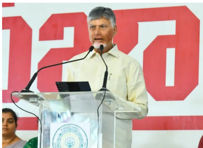
ముఖ్యమంత్రి చంద్రబాబు తీవ్రస్థాయిలో విమర్శించారు. బహిరంగంగా నవ్వాలన్న భయపడే పరిస్థితి ఉండేదని వ్యాఖ్యానించారు. మిగతా 2 లో