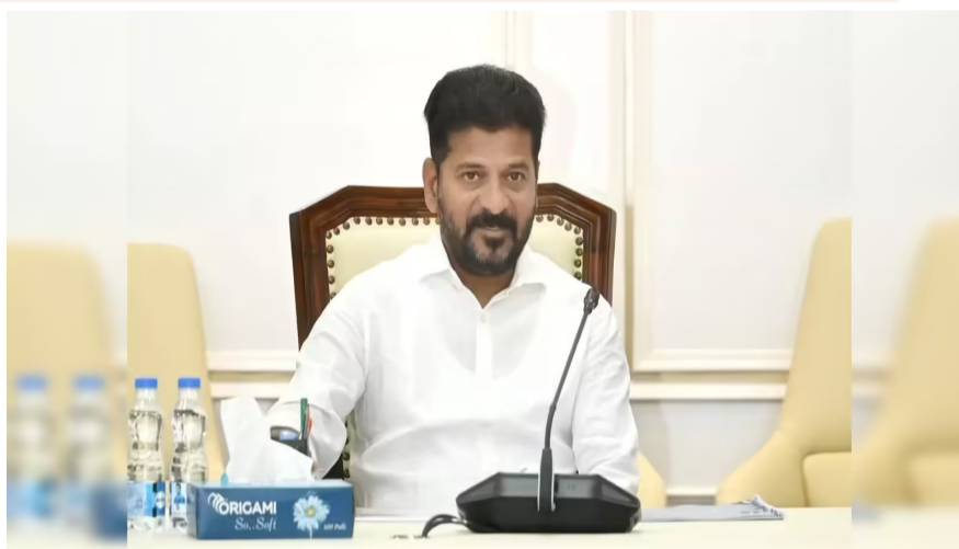
హైదరాబాద్: మోటార్లకు మీటర్లు పెట్టినా.. రైతులకు ఉచిత విద్యుత్ నిలిపివేసినా మేం ఎన్నికల్లో పోటీ చేయం.. ఒక వేళ మోటార్లకు మీటర్లు పెట్టకపోయినా.. ఉచిత విద్యుత్ కొనసాగించినా అంటూ ఆ పార్టీకి సీఎం రేవంత్ రెడ్డి మిగతా 2 లో