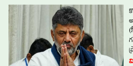
కర్ణాటక: కర్ణాటక ముఖ్యమంత్రి పదవి ఎంపికపై ఉత్సాహం కొనసాగుతున్న వేళ, పీసీసీ అధ్యక్షుడు డీకే శివకుమార్ అనూహ్యంగా పాపాలు కడిపారు. కాంగ్రెస్ శాసనసభా పక్ష (సీఎల్పీ) సమావేశం జరగడానికి ముందే ఆయన శనివారం గవర్నర్ థావరచంద్ గెజ్వత్తో భేటీ కావడం రాజకీయంగా ప్రాధాన్యం సంతరించుకుంది. తన సోదరుడు, మాజీ ఎంపీ మిగతా 2 లో