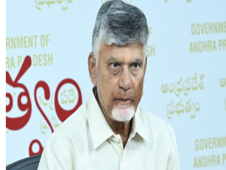
అమరావతి: "డిజిటల్ అరెస్ట్ పేరుతో ఫోన్లు చేసి ప్రజలను భయపెడుతూ డబ్బులు దోచుకునే వాళ్ల అరెస్ట్ కావాలి. ఆ దిశగా కఠిన చర్యలు తీసుకోవాలి" మిగతా 2 లో

} ఫిర్యాదు అందిన వెంటనే జీరో ఎఫ్ఐఆర్ నమోదుకు ఆదేశాలు } ఆరు స్తంభాల వ్యవస్థతో సైబర్ నేరాలను అలకట్టేందుకు పోలీసు శాఖ ప్రణాళిక } ఏపీలో నేరం చేస్తే తప్పించుకోలేమనే భయం నేరగాళ్లకు కలగాలని సీఎం స్పష్టం