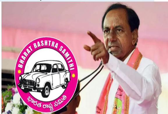
హైదరాబాద్: రాష్ట్రంలో కాంగ్రెస్ ప్రభుత్వానికి వ్యతిరేకంగా సాగుస్తున్న రాజకీయ పోరుకు మరింత పదును పెట్టేందుకు బీఆర్ఎస్ సన్నద్ధమైంది. ఎన్నికల హామీల అమలులో వైఫల్యం. మిగతా 2 లో

జేఆర్ఎస్ భారీ వ్యూహం.. కేసీఆర్ దూకుడు కాంగ్రెస్ హామీల అమలు వైఫల్యంపై నిరంతర రాజకీయ దాడి కాంగ్రెస్ వ్యతిరేక ఓటు జిజ్ఞాస వైపు వెళ్లకూండా ప్రత్యేక ప్రణాళిక సంస్కారంగా పార్టీ బలోపేతం దిశగా కార్యాచరణ మూర్తీ పై అవగాహన పేరిట గ్రేటర్ ఎన్నికలపై స్పెషల్ సజర్ జెన్ జీని చేరుకోవడం లక్ష్యంగా ప్రత్యేకంగా ముఖాముఖం