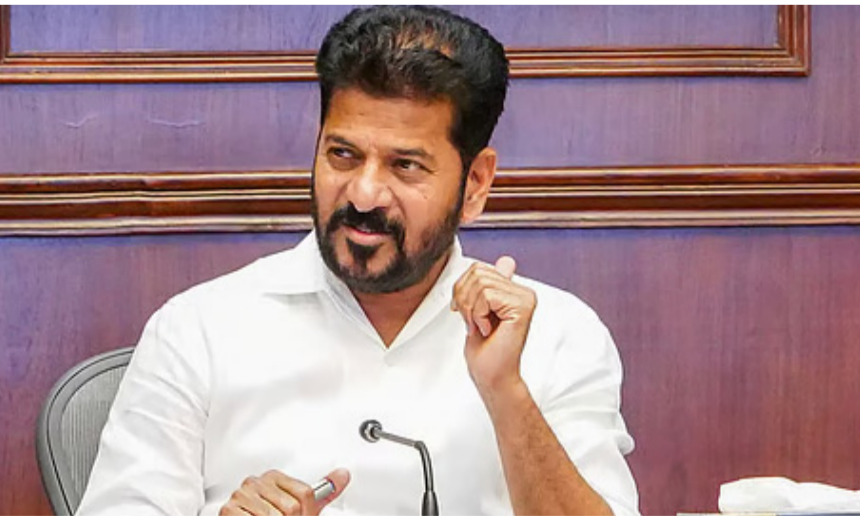
హైదరాబాద్: ఇకపై క్షేత్రస్థాయి కార్యకర్తలను తాను 10 రోజులకోసారి కలుస్తానని, నెలలో మూడు రోజులు వారి కోసం సమయం కేటాయిస్తానని సీఎం రేవంత్ రెడ్డి చెప్పారు. అందరూ పార్టీ కోసం కష్టపడి పనిచేయాల్సిందేనన్నారు. గాంధీభవన్లో జరిగిన కాంగ్రెస్ రాష్ట్ర రాజకీయ వ్యవహారాల కమిటీ (సీపీసీ) సమావేశంలో ఆయన మాట్లాడారు. "మంత్రులు.. తాము ఇన్చార్జిగా ఉన్న జిల్లాకు ప్రతి 10 రోజుల్లో ఒకరోజు వెళ్లి.. పార్టీ కార్యక్రమాల కోసం పూర్తి సమయం కేటాయించాలి. మిగతా 2 లో

క్షేత్రస్థాయి కార్యకర్తలను తాను 10 రోజులకోసారి కలుస్తా