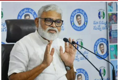
మోసాపూరిత రాజకీయాలు చేయడంలో చంద్రబాబు నెంబర్ వన్ అని విమర్శించారు వైఎస్సార్ సీపీ నేత, మాజీ మంత్రి అంబటి రాంబాబు. మిగతా 2లో

చంద్రబాబు వైఖరిని బీజేపీ బాగా అజ్బర్స్ చేస్తుంది. ● మోసాపూరిత రాజకీయాలు చేయడంలో చంద్రబాబు నెంబర్ వన్ అని విమర్శించారు వైఎస్సార్ సీపీ నేత, మాజీ మంత్రి అంబటి రాంబాబు. ● బహిరంగంగా బీజేపీతో ఉంటూ తెరచాటున కాంగ్రెస్ తో ఉంటున్నారని అంబటి విమర్శించారు