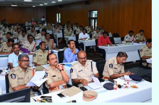
నేర నియంత్రణ లక్ష్యం గంజాయి అమ్మే వారిని, సేవించే వారిని గుర్తించేందుకు జిల్లాలో విస్తృతంగా డ్రగ్ డిటెక్షన్ కిట్స్ తో తనిఖీలు నిర్వహించాలన్నారు. ఏపీ డిజిపి గారి ఆదేశాల మేరకు జూన్ 1 నుండి 30 వరకు