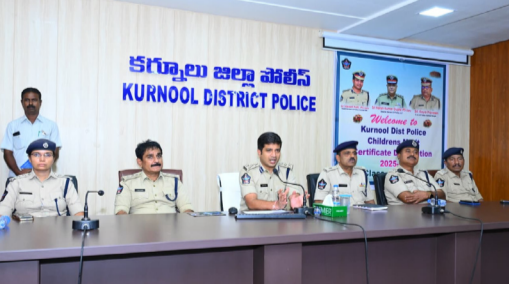
శాతానికి పైగా మార్పులు సాధించిన 20 మంది విద్యార్థులను ప్రత్యేకంగా అభినందించారు. వారి ప్రతిభను గుర్తిస్తూ అభినందన పత్రాలు మరియు ఫ్యాన్ ట్రాక్ వాలెట్లను బహుమతులుగా అందజేశారు. ఈ సందర్భంగా కర్నూలు ఎస్సీ మాట్లాడుతూ పదో తరగతి, ఇంటర్మీడియట్ విద్యార్థుల జీవితంలో అత్యంత కీలకమైన దశలన్నారు. ఈ స్థాయిలో సాధించిన ఫలితాలే భవిష్యత్లో ఇంజనీరింగ్, మెడిసిన్, సివిల్ సర్వీసెస్, ఉపాధ్యాయులుగా తదితర రంగాల్లో ఉన్నత స్థాయిలకు చేరుకునేందుకు పునాదిగా నిలుస్తాయని పేర్కొన్నారు. కష్టపడి చదవండి, లక్ష్యాధారణ కోసం నిరంతర శ్రమ, తల్లిదండ్రుల ప్రోత్సాహం విజయానికి ప్రధాన కారణాలని తెలిపారు. టెన్, ఇంటర్ తర్వాత కూడా నిరంతరం చేయకుండా ఎంసీబీ, పీజీ వంటి పోటీ పరీక్షల్లో ఉత్తమ ర్యాంకులు సాధించాలని విద్యార్థులకు సూచించారు. విద్య ద్వారా ఆర్థిక స్వావలంబన సాధించవచ్చని, ఉన్నత విద్యాభ్యాసంతో పాటు మంచి ఉద్యోగాలు సాధించి కుటుంబానికి, సమాజానికి ఆదర్శంగా నిలవాలని ఆకాంక్షించారు. భవిష్యత్తులో సివిల్ సర్వీసెస్, మెడిసిన్, ఇంజనీరింగ్ వంటి రంగాల్లో రాజీవి జిల్లాకు , రాష్ట్రానికి మంచి పేరు తీసుకురావాలని