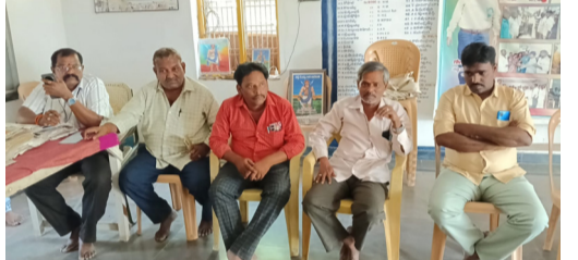
డోన్ టౌన్, మే 30, (సీమ కిరణం న్యూస్): డోన్ పట్టణంలోని పెన్సన్లలో ఉన్న వర్షం సంఘం కార్యకర్తలతో జే హెచ్ పీ ఎన్ జర్నలిస్ట్ హక్కుల పోరాట సమితి సమావేశం శనివారం ఉదయం నిర్వహించబడింది.