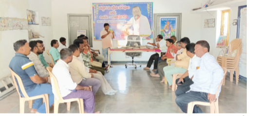
పట్టణం మరియు పరిసర ప్రాంతాల నుండి పెద్ద సంఖ్యలో జర్నలిస్టులు హాజరై సంఘం బలోపేతం, పాత్రికేయుల హక్కుల పరిరక్షణ, సంక్షేమ కార్యక్రమాలపై విస్తృతంగా చర్చించారు. ఈ సమావేశంలో జర్నలిస్టులు ఎదుర్కొంటున్న వివిధ సమస్యలు, వృత్తి నిర్వహణలో ఎదురవుతున్న ఇబ్బందులు, ప్రభుత్వ పరంగా

అందాల్సిన సంక్షేమ పథకాలు, భద్రతా చర్యలు వంటి అంశాలపై అభిప్రాయాలను వ్యక్తం చేశారు. పాత్రికేయుల ఇక్కడే వారి బలమని, హక్కుల సాధన కోసం అందరూ సమిష్టిగా ముందుకు రావాలని నాయకులు పిలుపునిచ్చారు. అలాగే జర్నలిస్టుల సంక్షేమ కోసం జే హెచ్ పీ ఎన్ చేపట్టనున్న భవిష్యత్ కార్యచరణపై చర్చించి, సంఘాన్ని మరింత బలోపేతం చేయడానికి పలు సూచనలు చేశారు. సమావేశంలో పాల్గొన్న జర్నలిస్టులకు అభిప్రాయాలను తెలియజేస్తూ, వృత్తి గౌరవాన్ని కాపాడేందుకు సంఘం చేస్తున్న కృషికి మద్దతు ప్రకటించారు. ఈ కార్యక్రమం స్నేహపూర్వక వాతావరణంలో సాగాగా, జర్నలిస్టుల ఇక్కడ, హక్కుల పరిరక్షణ, సంక్షేమ కోసం పరిష్కారం చురుకుగా పనిచేయాలని సమావేశం నిర్ణయించింది. ఈ కార్యక్రమం లో పలువురు సీనియర్ మరియు యువ జర్నలిస్టులు సమావేశంలో పాల్గొన్నారు.