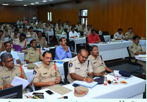
సేకరించి వారిపై నిఘా కొనసాగించాలన్నారు. రోడీ డిటెక్టర్ కు మానిటరింగ్ చేయాలన్నారు. మిస్సింగ్ కేసులు, డొంగలింబడిన వాహనాలను గుర్తించేందుకు ఆర్ డి జి ఎన్ , సీసీడీపీ 360 అప్లికేషన్ ద్వారా వస్తున్న అప్డేటులను ప్రతిరోజూ సమీక్షించాలన్నారు. " సీసీడీపీ ఏపీ 360 అప్లికేషన్ ను సమర్థవంతంగా వినియోగించాలన్నారు. 1930 సైబర్ హెల్పైలెన్ కు వచ్చిన కార్లో పై వెంటనే స్పందించాలన్నారు. 10 లక్షల పైగా జరిగిన సైబర్ మోసాలపై ఎఫ్ ఐ అర్ లు సమయం చేసి, వెంటనే దర్యాప్తులు చేపట్టాలన్నారు. డ్రాగ్స్ డ్రైవ్ కేసులలో పట్టుబడిన వారి నుండి జరిమానాలు కోర్టుకు మాత్రమే చెల్లించేవిధంగా చూడాలన్నారు. ఈ విషయంలో ఎవరైనా అలసత్వం, నిర్లక్ష్యం ప్రదర్శించే వారిపై కఠిన చర్యలు తీసుకుంటామన్నారు. ఒక సంవత్సరం క్రితం బదిలీ అయిన పోలీసు సిబ్బందిని పాత పోలీసు స్టేషన్ లలో కొనసాగించకుండా వారికి తీయించిన పోలీసు స్టేషన్లలోనే విధులు నిర్వహించాలా చర్యలు తీసుకోవాలన్నారు. ఈ నేర సమీక్ష సమావేశంలో టీగల్ అడ్వైజర్ మల్లికార్జున రావు, డిఎస్సీలు బాబు ప్రసాద్, వెంకట్రామయ్య , ఉపేంద్రబాబు, భారవి , సిబిలు, ఎస్పీలు పాల్గొన్నారు.