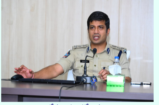
నేర నియంత్రణ లక్ష్యం గంజాయి అమ్మే వారిని, సేవించే వారిని గుర్తించాలి. విస్తృతంగా డ్రగ్ డిటెక్షన్ కిట్స్ తో తనిఖీలు నిర్వహించాలి కర్నూలు ఎస్సీ విక్రొత్తం పాటిల్ పోలీసు అధికారులతో నెల వారి నేర సమీక్షా సమావేశం