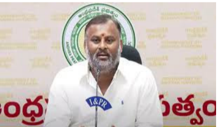
ఆంధ్రప్రదేశ్ లో ఏపీఎస్ఆర్టీసీ ప్రైవేటీకరణ కారితోందంటూ గత కొద్దిరోజులుగా ప్రచారం జరుగుతున్న సంగతి తెలిసింది. మిగతా 2లో