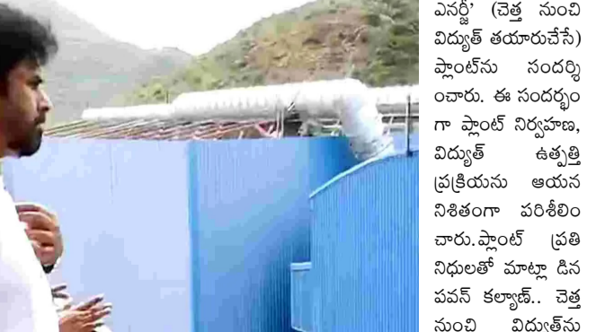
ఆంధ్రప్రదేశ్ ఉపముఖ్యమంత్రి పవన్ కళ్యాణ్ నెల్లూరు జిల్లా నాయుడుపేటలోని జిందాల్ 'వేస్ట్ టు ఎనర్జీ' (చెత్త నుంచి విద్యుత్ తయారుచేసే) ప్లాంట్ ను సందర్శించారు. ఈ సందర్భంగా ప్లాంట్ నిర్వహణ, విద్యుత్ ఉత్పత్తి ప్రక్రియను ఆయన నిశితంగా పరిశీలించారు. ప్లాంట్ ప్రతినిధులతో మాట్లాడిన పవన్ కళ్యాణ్.. చెత్త నుంచి విద్యుత్ ను ఉత్పత్తి చేయడానికి అవుతున్న వ్యయం, ప్లాంట్ రోజువారీ నిర్వహణ వివరాలను మిగతా 2లో

నాయుడుపేటలోని జిందాల్ ప్లాంట్ లో చెత్త నుంచి విద్యుత్ తయారీ ఉత్పత్తి, వ్యయం తదితర వివరాలను తెలుసుకున్న పవన్ కళ్యాణ్ కాకినాడ జిందాల్ ప్లాంట్ పై ఆరా తీసిన డిప్యూటీ సీఎం