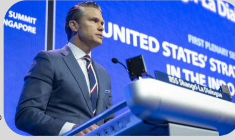
ఇండో-పసిఫిక్ ప్రాంతంలో భారత్ ఒక 'శక్తివంతమైన దేశం' అని, ప్రాంతీయ బలాల సమతుల్యతకు కీలకమైన శక్తిగా నిలుస్తోందని అమెరికా రక్షణ శాఖ మంత్రి మిగతా 2లో

● ఇండో-పసిఫిక్ ప్రాంతంలో భారత్ ఒక కీలక శక్తి అని కొనియాడే అమెరికా ● సింగపూర్ లోని షాంగ్రీ-లా సదస్సులో యూఎస్ రక్షణ మంత్రి పీట్ హెగ్గెట్ వ్యాఖ్యలు ● భారత్ తన సైన్యాన్ని వేగంగా ఆధునికీకరిస్తోందని ప్రశంస ● మిత్రదేశాలు రక్షణ వ్యయాన్ని పెంచాలని అమెరికా పిలుపు