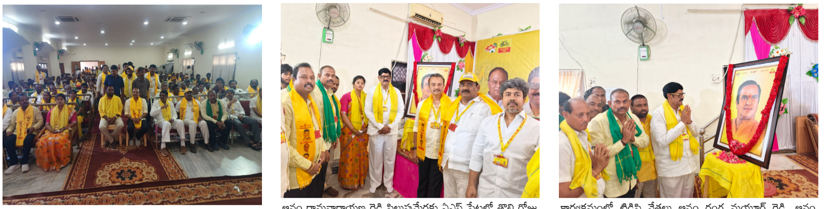
ఉత్సాహంగా పాల్గొన్న డిజిటిల్ నాయకులు, కార్యకర్తలు, అభిమానులు