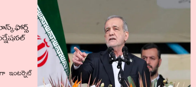
అమెరికా- ఇరాన్ యుద్ధం నేపథ్యంలో ఇరాన్ లో గత కొన్ని నెలలుగా ఇంటర్నెట్ నిలిచిపోయింది. తాజాగా ఇంటర్నెట్ కనెక్టివిటీపై విధించిన మిగతా 2లో