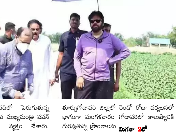
పవిత్ర గోదావరి నదిలో పెరుగుతున్న కాలుష్యంపై ఆంధ్రప్రదేశ్ ఉప ముఖ్యమంత్రి పవన్ కల్యాణ్ తీవ్ర ఆగ్రహం వ్యక్తం చేశారు. మిగతా 2లో

భవిష్యత్తులో గోదావరి, కృష్ణా 'వెలవెల' గోదావరి నది కాలుష్య పరిస్థితిపై క్షేత్రస్థాయి పరిశీలన చేసిన పవన్