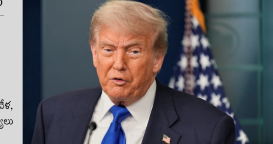
వాషింగ్టన్: దోహాలో అమెరికా-ఇరాన్ శాంతి ఒప్పందంపై చర్చలు జరుగుతున్న వేళ, అమెరికా అధ్యక్షుడు డొనాల్డ్ ట్రంప్ ట్రాక్ సోషల్ వేదికగా కీలక వ్యాఖ్యలు చేశారు. 'యుద్ధం ఎవరూ కోరుకోవడం లేదు..కానీ ఈ ఒప్పందం మిగతా 2లో