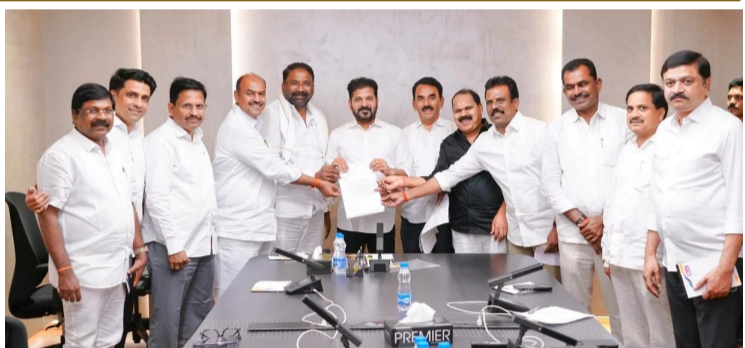
హైదరాబాద్ : ముఖ్యమంత్రి రేవంత్ రెడ్డి ఉమ్మడి మహబూబ్ నగర్ జిల్లా మంత్రులు, ఎమ్మెల్యేలతో భేటీ అయ్యారు. ఆ జిల్లా సాగునీటి ప్రాజెక్టు పనుల పురోగతిపై ఎంపీ ఆర్ హెచ్ ఆర్ డీలో సమీక్షా సమావేశం నిర్వహించారు. పాలమూరు-రంగారెడ్డి ప్రాజెక్టు భూసేకరణ ప్రక్రియను యుద్ధ ప్రాతిపదికన పూర్తి చేయాలని ఆదేశించారు. సాగునీటి ప్రాజెక్టులకు సంబంధించి - మిగతా 2 లో

ఉమ్మడి మహబూబ్ నగర్ జిల్లా మంత్రులు, ఎమ్మెల్యేలతో సీఎం రేవంత్ రెడ్డి భేటీ - సాగునీటి ప్రాజెక్టు పనుల పురోగతిపై సమీక్షా సమావేశం - పెండింగ్ బిల్లులను క్లియర్ చేయడానికి ప్రభుత్వం సిద్ధంగా ఉందని హామీ