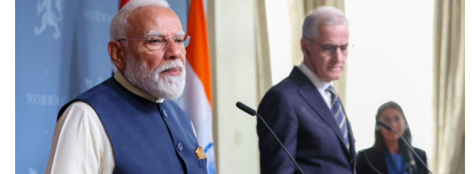
ఢిల్లీ : ప్రధాని నరేంద్ర మోదీ నార్వే పర్యటనలో అసక్తికర ఘటన చోటు చేసుకుంది. భారత ప్రజాస్వామ్యం, మీడియా స్వేచ్ఛ పై ప్రశ్నలు లేవనెత్తిన ఓ నార్వేజియన్ జర్నలిస్టుకు, భారత విదేశాంగ శాఖ అధికారి ఘాటుగా సమాధానం మిచ్చారు. 'ఏమైనా సమస్యలుంటే కోర్టుకు వెళ్లండి' అంటూ ఆయన ఇచ్చిన జవాబు ప్రస్తుతం సోషల్ మీడియాలో వైరల్ అవుతోంది. బిదేశాంగ శాఖ పర్యటనలో భాగంగా - మిగతా 2 లో

ఘాటుగా సమాధానం ఇచ్చిన బిదేశాంగ శాఖ అధికారి