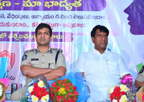
కర్నూలు ఎస్సీ వికాస్ పాఠశాలలో ఎమ్మిగనూరు వెంకటాచార్య కాలనీలో "మీ రక్షణ - మా బాధ్యత" అవగాహన కార్యక్రమం