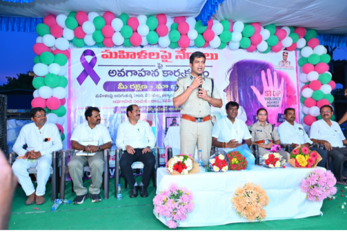
వినియోగించుకోవాలని సూచించారు. అత్యవసర పరిస్థితుల్లో డయల్ 112, 100, 181, 1098, 1930