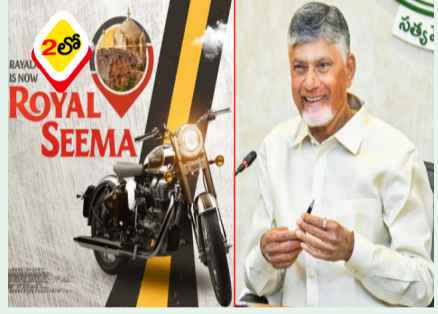
అమరావతి: ఆంధ్రప్రదేశ్ ప్రభుత్వ పరిపాలనలో సాంకేతికతను జోడించి, ఫైళ్ల క్లియరెన్స్ లో వేగాన్ని పెంచడంపై ముఖ్యమంత్రి చంద్రబాబు విగతా..26

'రాయలసీమ ఇక రాయల్ సీమ'.. సీఎం చంద్రబాబు ఆసక్తికర పోస్ట్ ● ఏపీకి రానున్న ప్రముఖ బ్లైక్ తయారీ సంస్థ రాయల్ ఎన్ఫీల్డ్ ● తిరుపతి జిల్లా సత్కవేడులో రూ. 2,200 కోట్ల పెట్టుబడి ● 'రాయలసీమ ఇప్పుడు రాయల్ సీమ' అంటూ సీఎం చంద్రబాబు ట్వీట్