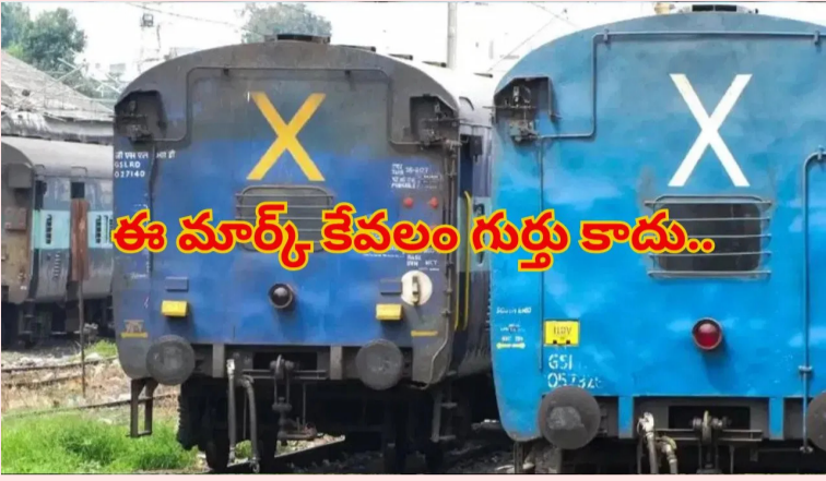
ఈ మార్క్ కేవలం గుర్తు కాదు..

మనం రైల్వే స్టేషన్లో ఉన్నప్పుడు లేదా రైలు వెళ్తున్నప్పుడు గమనిస్తే, చివరి బోగీ వెనుక పసుపు రంగులో పెద్ద ౩ గుర్తు కనిపిస్తుంది. చాలా మంది ఇది కేవలం ఒక అలంకరణ లేదా గుర్తు అనుకుంటారు. కానీ, భారతీయ రైల్వే వ్యవస్థలో దీనికి అత్యంత ప్రాధాన్యత ఉంది. ఇది రైల్వే సిబ్బందికి, ప్రయాణికుల భద్రతకు సంబంధించిన ఒక కీలకమైన సంకేతం. అదేంటో ఇప్పుడు చూద్దాం.. మనం రైలు ప్రయాణం చేస్తున్నప్పుడు లేదా స్టేషన్లో ఉన్నప్పుడు మనం గమనించే అతి ముఖ్యమైన భద్రతా సంకేతం. ఈ పసుపు రంగు గుర్తు, రైలు తన అన్ని బోగీలతో కలిసి పూర్తిస్థాయిలో ప్రయాణిస్తోందని స్టేషన్ సిబ్బందికి సూచిస్తుంది. రైలు పట్టణంపై ప్రయాణిస్తున్నప్పుడు కొన్నిసార్లు సాంకేతిక కారణాల వల్ల లేదా లోపం వల్ల విద్యుత్ సరఫరాలో తగ్గుదల ఏర్పడితే ప్రయాణం ఆపివేయవలసి ఉంటుంది. ఒకవేళ రైలు ఇంజనీ కొన్ని బోగీలను లాక్చేసి, మిగిలినవి పట్టణంపై ఉండిపోతే వెనుక వచ్చే రైలు వాటిని డీకాన్ అవకాశం ఉంది. స్టేషన్ మాస్టర్ లేదా గేట్ మాస్టర్ రైలు వెళ్తున్నప్పుడు ఈ ౩ గుర్తును గమనిస్తారు. ఈ గుర్తు కనిపిస్తే, రైలు క్రేములా అన్ని బోగీలతో డాటిందని వారు నిర్ధారించుకుంటారు.