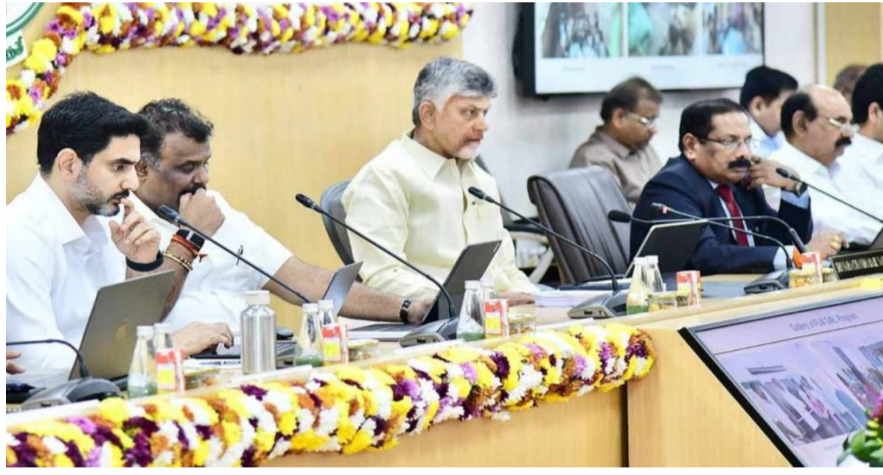
అమరావతి: సీఎం చంద్రబాబు నాయుడు నేతృత్వంలో 7వ కలెక్టర్ల కాన్ఫరెన్స్ సచివాలయంలో ప్రారంభమైంది. రాష్ట్ర పాలనలో కీలకమైన ఈ సమావేశంలో ప్రభుత్వ ప్రధాన కార్యదర్శి సాయి

★ రూ.23 లక్షల కోట్ల పెట్టుబడులకు ఎంపీయూలు కుదిరాయని వెల్లడి