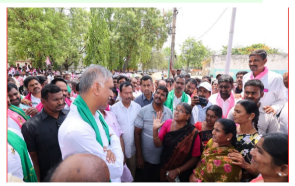
హైదరాబాద్: వడ్ల కుప్పల వద్ద రైతుల గుండెలు ఆగిపోతున్నా ముఖ్యమంత్రి రేవంత్ రెడ్డికి కనీస కనికరం లేదని టీఆర్ఎస్ సీనియర్ ఎమ్మెల్యే హరీశ్ రావు మండిపడ్డారు. విగతా..26

నెల రోజులుగా వడ్లను కొనుగోలు చేయడం లేదని విమర్శ తరుగు పేరుతో రైతులను దోచుకుంటున్నారని ఆరోపణ