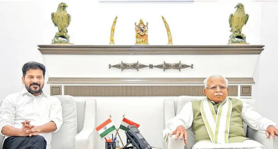
న్యూఢిల్లీ: తాజాగా జరిగిన ఐదు రాష్ట్రాల ఎన్నికల్లో భాగంగా కేరళలో ప్రధాని మోదీ, కేంద్ర హోంమంత్రి అమిత్ షాను ఓడించామని సీఎం రేవంత్ రెడ్డి వ్యాఖ్యానించారు. బుధవారం మధ్యాహ్నం ఢిల్లీకి వచ్చిన ఆయన విమానాశ్రయంలో విలేజరులు అడిగిన ఒక ప్రశ్నకు స్పందించారు. 'కేరళలో కాంగ్రెస్ విజయం సాధించింది. అక్కడ రాహుల్, ప్రయోంకా గాంధీ, మల్లికార్జున ఖర్గేలు సరేంద్ర మోదీ, విగతా..26