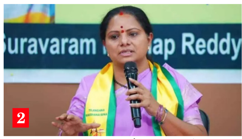
హైదరాబాద్: తెలంగాణ జాగృతి సంస్థ ఇక్కడ ఎన్టీవోగా పనిచేస్తుందని, తెలంగాణ రక్షణ సేన (టీఆర్ఎస్) జెన్ జీ యువత లక్ష్యంగా ముందుకు వెళ్తుందని ఆ పార్టీ అధ్యక్షురాలు

ఇకపై తెలంగాణ జాగృతి ఎన్టీవోగా పని చేస్తుందన్న కవిత తెలంగాణ ఉద్యమకారుల కోసం లక్ష్య సూపర్ న్యూమలికల్ ఉద్యోగాలను క్రియేట్ చేస్తామని హామీ రేవంత్ ఇక్కడ ఉన్నా.. సిమ్ కార్డు ఢిల్లీలో ఉంటుందని ఎద్దేవా