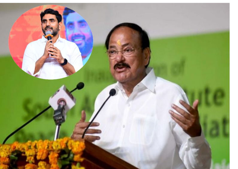
పరిమితం అవుతున్నారని ఆయన ఆవేదన వ్యక్తం చేశారు. పిల్లలతో గడపడం ద్వారానే మంచి విలువలను అందించగలమని పేర్కొన్నారు. ప్రస్తుత సమాజంలోని పరిస్థితులపై వెంకయ్య నాయుడు తీవ్ర ఆందోళన వ్యక్తం చేశారు. రోజూ పత్రికల్లో పస్తున్న కొన్ని వార్తలను చూస్తుంటే