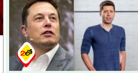
హైదరాబాద్: టెస్లా కంపెనీ టెస్లా పిపిఎస్ పై టెస్లా సీఈఓ ఎలాన్ మస్క్ కోర్టులో వాంగ్మూలం

సంచలన ఆరోపణలు పిపిఎస్ పై టెస్లా సీఈఓ ఎలాన్ మస్క్ కోర్టులో వాంగ్మూలం