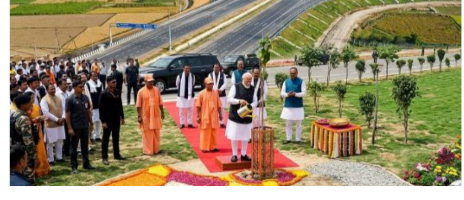
ఢిల్లీ: ఉత్తరప్రదేశ్ అభివృద్ధికి కొత్త జీవనాడిగా మారి గంగా ఎక్స్ ప్రెస్ వేను ప్రధాని నరేంద్ర మోదీ బుధవారం ప్రారంభించారు. హార్ద్వార్ లో జరిగిన ఒక బహిరంగ సభలో, సుమారు రూ. 36,230 కోట్ల వ్యయంతో నిర్మించిన ఈ ప్రతిష్టాత్మక ప్రాజెక్టును ఆయన జాతికి అంకితం చేశారు. గంగా మాత పరిసర ప్రాంతాల గుండా వెళ్లే ఈ ప్రాజెక్టు ఉత్తరప్రదేశ్ మిగతా.. 2లో