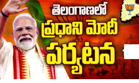
హైదరాబాద్ : మే 10వ తేదీన ప్రధాని మోదీ తెలంగాణలో పర్యటించనున్నారు. కేంద్రంలో మోదీసారీ బాధ్యతలు చేపట్టిన మిగతా.. 2లో