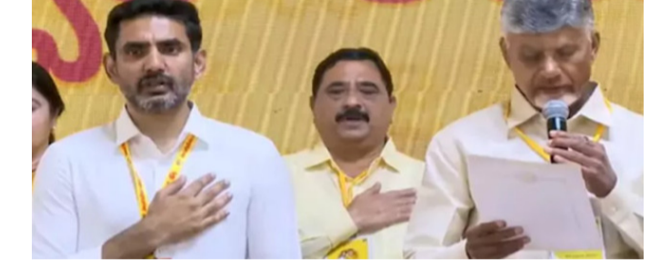
అమరావతి: తెలుగుదేశం పార్టీ యువనేత, మంత్రి నారా లోకేశ్ జాతీయ వర్కంగ్ ప్రెసిడెంట్ గా ప్రమాణస్వీకారం చేశారు. మిగతా.. 2లో

టీడీపీ వర్కంగ్ ప్రెసిడెంట్ గా నారా లోకేశ్ ప్రమాణస్వీకారం నారా లోకేశ్ చేత ప్రమాణస్వీకారం చేయించిన చంద్రబాబు ప్రమాణస్వీకారం చేసిన పొలిట్ బ్యూరో, ఇతర కమిటీల నేతలు మంగళగిరిలోని టీడీపీ కేంద్ర కార్యాలయంలో జరిగిన కార్యక్రమం