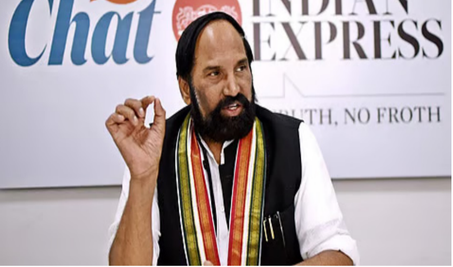
హైదరాబాద్: తెలంగాణలో గత మూడు రోజులుగా పలు ప్రాంతాల్లో నెలకొన్న పెట్రోల్, డీజిల్ కొరతపై రాష్ట్ర ప్రభుత్వం స్పష్టతనిచ్చింది. ఇంధన ధరలు భారీగా పెరగబోతున్నాయంటూ వ్యాపించిన వదంతుల వల్లే ఈ కృత్రిమ కొరత ఏర్పడిందని పౌరసరఫరాల శాఖ మంత్రి ఉత్తమ్ కుమార్ రెడ్డి వెల్లడించారు. ప్రజలు ఆందోళనతో అవసరానికి మించి ఇంధనాన్ని కొనుగోలు చేస్తుండటంతో బంకుల వద్ద భారీ రద్దీ ఏర్పడి, డిమాండ్ అకస్మాత్తుగా పెరిగిందని వివరించారు. మిగతా.. 2లో