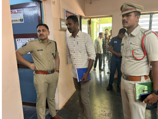
చట్ట వ్యతిరేక కార్యకలాపాలకు పాల్పడితే కఠిన చర్యలు తప్పవు.