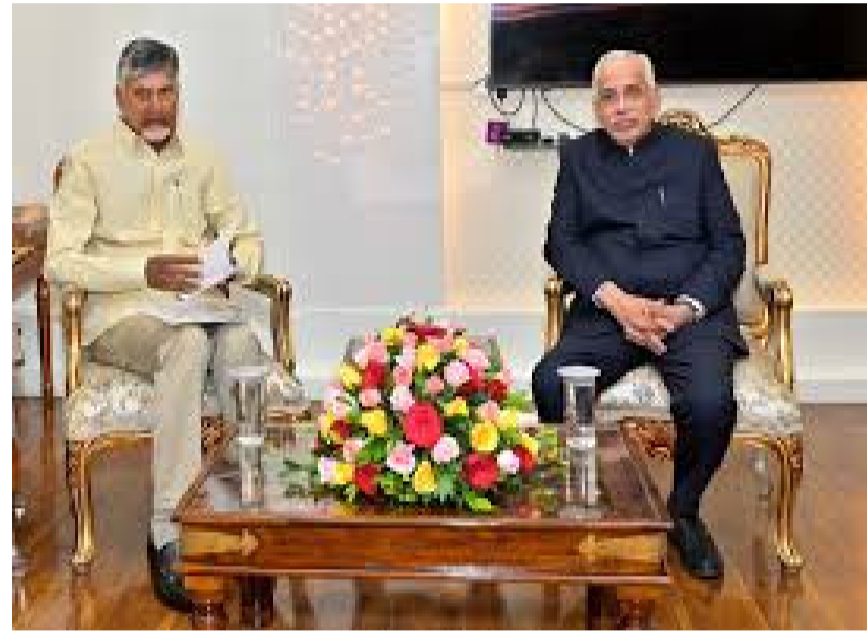
విజయవాడలోని లోక్ భవన్లో గవర్నర్ ను మర్యాదపూర్వకంగా పరామర్శించిన సీఎం చంద్రబాబు

తెలుసుకున్న ముఖ్యమంత్రి గవర్నర్ త్వరగా పూర్తి ఆరోగ్యంతో కోలుకోవాలని ఆకాంక్ష అమరావతి: ఆంధ్రప్రదేశ్ ముఖ్యమంత్రి చంద్రబాబు శనివారం రాష్ట్ర గవర్నర్ ఎన్. ఆర్. జైన్ కు లోక్ భవన్లో గవర్నర్ ను ఆయన మర్యాదపూర్వకంగా కలుసుకున్నారు. ఇటీవలే స్వల్ప అనారోగ్యంతో ఆసుపత్రిలో చికిత్స పొంది డిశ్చార్జ్ అయిన గవర్నర్ ఆరోగ్య పరిస్థితి గురించి సీఎం ఆరా తీశారు. ఈ సందర్భంగా గవర్నర్ ను పరామర్శించిన చంద్రబాబు, ఆయన ఆరోగ్య వివరాలను అడిగి తెలుసుకున్నారు. గవర్నర్ త్వరగా పూర్తి ఆరోగ్యంతో కోలుకుని, విధులకు హాజరు కావాలని ఆకాంక్షించారు. అనారోగ్యం కారణంగా ఆసుపత్రిలో చేరిన గవర్నర్, చికిత్స అనంతరం కోలుకుని లోక్ భవన్ కు తిరిగి వచ్చారు. ఈ సందర్భంలో ముఖ్యమంత్రి ఆయన్ను పరామర్శించేందుకు వెళ్లారు. ఈ భేటీ కేవలం మర్యాదపూర్వక పరామర్శ మాత్రమేనని అధికార పర్చాల తెలిపారు.