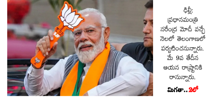
ప్రధానమంత్రి నరేంద్ర మోదీ వచ్చే నెలలో తెలంగాణలో పర్యటించనున్నారు. మే 9న తీవ్ర ఆయన రాష్ట్రానికి రానున్నారు. విగత.. 2లో

ప్రధాని నరేంద్రమోదీ తెలంగాణ పర్యటన ఖరారు మే 9న తెలంగాణకు రానున్న ప్రధాని మోదీ - పలు అభివృద్ధి కార్యక్రమాల్లో పాల్గొననున్న మోదీ - పరేడ్ మైదానంలో భారీ బహిరంగ సభ