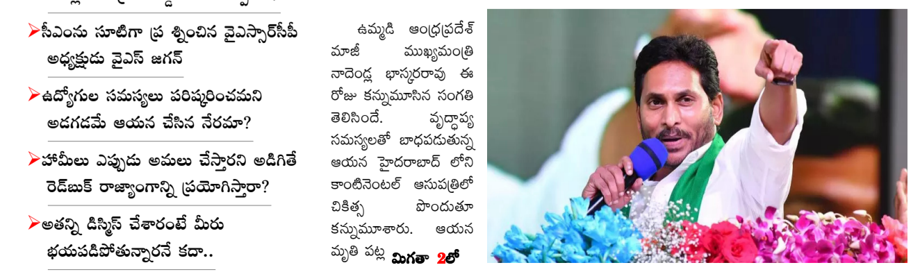
ఉమ్మడి ఆంధ్రప్రదేశ్ మాజీ ముఖ్యమంత్రి నాదెండ్ల భాస్కర్ రావు ఈ రోజు కన్నుమూసిన సంగతి తెలిసిందే. వృద్ధాప్య సమస్యలతో బాధపడుతున్న ఆయన హైదరాబాద్ లోని కాంటినెంట్ల ఆసుపత్రిలో చికిత్స పొందుతూ కన్నుమూశారు. ఆయన మృతి వట్ల విగతా 2లో

నాదెండ్ల భాస్కర్ రావు మరణం రాష్ట్రానికి తీరని లోటు: జగన్ ఏపీ రాజకీయాల్లో నాదెండ్లది విశిష్ట స్థానమని కితాబు కన్నాలో ఉన్న వారికి వైఎస్ జగన్ భరోసా చంద్రబాబూ.. తప్పు చేస్తున్నారు