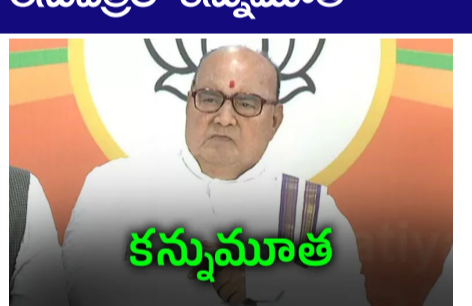
సీనియర్ నేత, మాజీ ముఖ్యమంత్రి నాదెండ్ల భాస్కర్ రావు ఇక లేరు. కొంతకాలంగా అనారోగ్యంగా ఉన్న ఆయన ఓ ప్రైవేట్ ఆస్పత్రిలో చికిత్స విగతా 2లో