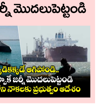
ఎక్కడికక్కడే ఆగిపోయింది.. మేం చెప్పాకే జర్నీ మొదలుపెట్టండి హోర్నాఫ్ట్లోని నౌకలకు ప్రభుత్వం ఆదేశం

● హోర్నాఫ్ట్లోని నౌకలకు ప్రభుత్వం ఆదేశం ● ప్రపంచ చమురు రవాణాకు అత్యంత కీలకమైన హోర్నాఫ్ట్ జలసంధిలో రెండు భారత దేశ నౌకలపై ఇరాన్ దళాలు దాడి చేయడంతో కేంద్ర ప్రభుత్వం అప్రమత్తమైంది న్యూఢిల్లీ: ప్రపంచ చమురు రవాణాకు అత్యంత కీలకమైన హోర్నాఫ్ట్ జలసంధిలో రెండు భారత దేశ నౌకలపై ఇరాన్ దళాలు మిగతా 2లో