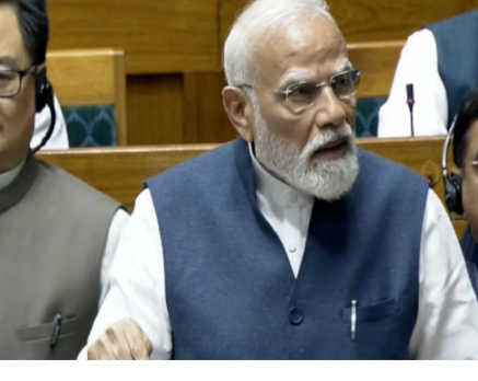
ఢిల్లీ: మహిళా రిజర్వేషన్ బిల్లు దేశ రాజకీయాల దిశ, దిశను మార్చేస్తుందని ప్రధానమంత్రి నరేంద్ర మోదీ అన్నారు. దేశ జనాభాలో సగభాగమైన మహిళలు నిర్ణయాధికార ప్రక్రియలో పాలుపంచుకోవడం ద్వారా దేశానికి కొత్త దిశానిర్దేశం