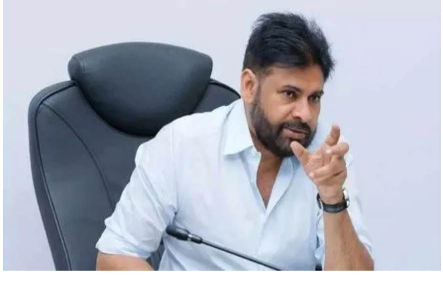
అమరావతి: ప్రధాని నరేంద్ర మోదీ నాయకత్వంలో తీసుకువచ్చిన 'నారీ శక్తి చట్టం' అధినాయం సవరణ బిల్లు' ఒక చరిత్రాత్మక ముందడుగు అని ఏపీ డిప్యూటీ సీఎం, జనసేన అధినేత పవన్ కల్యాణ్ అన్నారు. చట్టసభల్లో మహిళలకు 33 శాతం రిజర్వేషన్లు కల్పించడం ద్వారా