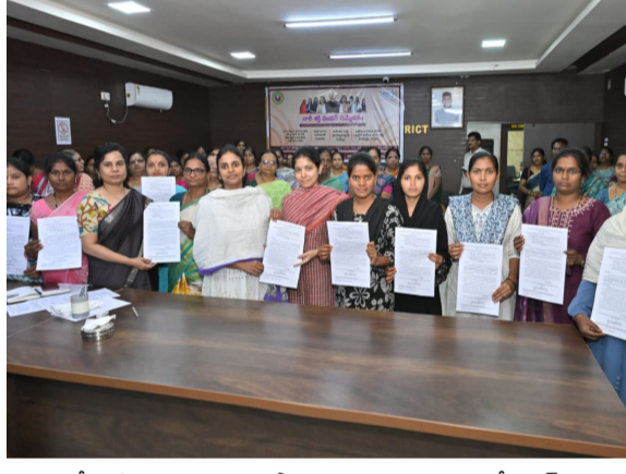
చర్వులు తీసుకుంటున్నాయని తెలిపారు. ఈ సందర్భంగా ఆదోని వన్ సూపర్వైజర్లు, స్వయం సహాయక సంఘాల మహిళలు పాల్గొన్నారు.