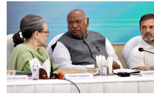
పార్లమెంటు వ్యూహం: కేవలం మూడు రోజుల పాటు జరగనున్న పార్లమెంటు ప్రత్యేక సమావేశాల్లో కేంద్ర ప్రభుత్వం తీసుకురాలోయే బిల్లులను ఎలా అడ్డుకోవాలి లేదా చర్చలో ఎలా పైచేలు సాధించాలనే అంశంపై సభ్యులకు కాంగ్రెస్ అగ్రనేతలు దిశానిర్దేశం చేశారు. రాజకీయ ప్రాధాన్యత రాజ్ లో సాంస్కృతిక ఎన్నికలను దృష్టిలో ఉంచుకుని నరేంద్రమోడీ ప్రభుత్వం అనుభవ్యంగా ప్రత్యేక సమావేశాలను విలపడంతో ఈ జడజడ భేటీకి ప్రాధాన్యం సంకల్పించుకుంది. ముఖ్యంగా తెలంగాణ వంటి రాష్ట్రాల్లో అమలు చేస్తున్న సంక్షేమ

తెలంగాణ సీఎం రేవంత్ రెడ్డి, కర్ణాటక సీఎం సిద్ధరామయ్య, హిమాచల్ ప్రదేశ్ సీఎం సుశీలందర్ సింగ్ సుక్కు ఈ సమావేశంలో పాల్గొని తమ రాష్ట్రాల నివేదికలను సమర్పించారు. చర్చకు రానున్న ప్రధాన అంశాలు.. కేంద్ర ప్రభుత్వం ప్రత్యేక పార్లమెంట్ సమావేశాలను ప్రకటించిన నేపథ్యంలో కాంగ్రెస్ ప్రధానంగా ఈ క్రింది అంశాలపై తన వాదనీ వినిపించాలని నిర్ణయించింది. మహిళా రిజర్వేషన్ బిల్లు: చట్టసభల్లో మహిళలకు 33 శాతం రిజర్వేషన్ల కల్పించే బిల్లుపై కాంగ్రెస్ పార్టీ స్పష్టమైన వైఖరిని ఖరారు చేయనుంది. ఓ.బీసీ మహిళలకు ఉప కోటా కల్పించాలనే డిమాండ్ పై కూడా చర్చించారు. నియోజకవర్గాల పునర్విభజన: 2026 తర్వాత జరగనున్న నియోజకవర్గాల పునర్విభజన వల్ల దక్షిణాది రాష్ట్రాలకు జరిగే మార్పులపై సీఎంల రేవంత్ రెడ్డి, సిద్ధరామయ్య తమ వాదనలు వినిపించారు. పశ్చిమానియా సంక్షోభం: అంతర్జాతీయంగా నెలకొన్న ఉద్రిక్తతలు, భారతదేశంపై వాదీ ప్రభావం, భారత్ అనుసరిస్తున్న విదేశాంగ విధానంపై చర్చించారు.