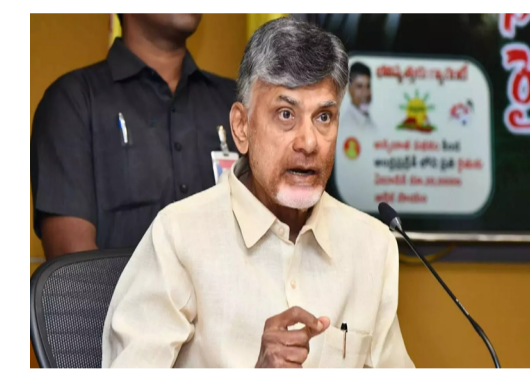
నిర్వహించారు. క్రమోద్ధారణ, (ఫెసిలిటీ ఎలక్ట్రానిక్స్ వంటి రంగాల్లో స్వదేశీ ఉపకరణాల తయారీకి ఈ కేంద్రం ఊతమివ్వనుంది. గ్లోబల్ హాజ్ గా క్యాంటం వ్యాప్తి

మూడు దశాబ్దాల క్రితం బడి విప్లవంతో రాష్ట్రాన్ని ప్రగతి పథంలో నడిపిన చంద్రబాబు, ఇప్పుడు క్యాంటం టెక్నాలజీతో ఏపీ భవిష్యత్తుకు బలమైన పునాదులు వేస్తున్నారు. హార్ట్ నెట్ తయారీకి కేంద్రంగా అమరావతి కేవలం సాఫ్ట్ వేర్ అభివృద్ధిలోనే పరిమితం కాకుండా క్యాంటం కంప్యూటర్ హార్డ్ వేర్ తయారీలోనూ స్వయం సంపూర్ణ సాధించాలన్నది ముఖ్యమంత్రి చంద్రబాబు లక్ష్యం. ఈ ఆశయ సాధనలో భాగంగానే అమరావతిలో ఈ టెక్నోని ఫెసిలిటీలను ఏర్పాటు చేశారు. మొత్తం 273 డిగ్రీలు సెల్యూయస్ అత్యంత శీతల ఉష్ణోగ్రత వద్ద పనిచేసే ఈ కేంద్రాల్లో, క్యాంటం కంప్యూటర్లకు అవసరమైన పరికరాలను పరీక్షించి, సర్టిఫికేషన్ ఇస్తారు. ఇటీవలే 30కి పైగా క్యాంటం హార్డ్ వేర్ తయారీ సంస్థలతో సీఎం సమావేశమై, అమరావతిని దేశ క్యాంటం హార్డ్ వేర్ నెట్ వర్క్కు యాంకర్ నోడ్ గా తీర్చిదిద్దాలని