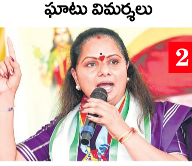
హైదరాబాద్: మహిళల భద్రతే లక్ష్యంగా ఓ నేత్ర టీమ్ను ఆయన ప్రారంభం