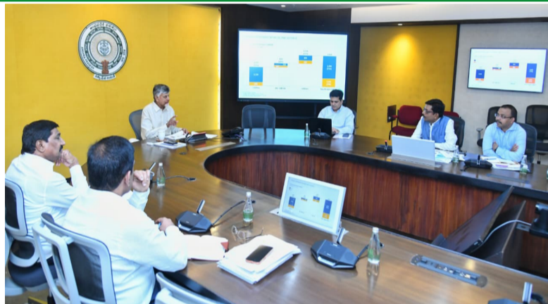
రాష్ట్రంలో కేవలం ప్రయాణ సౌకర్యాల కోసమే కాకుండా, ప్రజాస్వామ్య పంథాలోనే సమాధానం చెప్పాలని ఏపీ డిప్యూటీ సీఎం పవన్ కల్యాణ్ పిలుపునిచ్చారు. దాడులు చేయడం పరిష్కారం కాదని, మిగతా 2లో