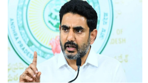
ఆంధ్రప్రదేశ్ విద్య, బిజీ శాఖల మంత్రి, తెలుగుదేశం పార్టీ జాతీయ ప్రధాన కార్యదర్శి నారా లోకేశ్ బుధవారం టీడీపీ నేతలతో సమీక్షా సమావేశం నిర్వహించారు. మిగతా 2లో

●పార్టీ సిద్ధాంతాలను ప్రజల్లోకి తీసుకెళ్లాలి ●ఆంధ్రప్రదేశ్ విద్య, బిజీ శాఖల మంత్రి, తెలుగుదేశం పార్టీ జాతీయ ప్రధాన కార్యదర్శి నారా లోకేశ్ బుధవారం టీడీపీ నేతలతో సమీక్షా సమావేశం నిర్వహించారు. ●పార్టీ కార్యాలయంలో జరిగిన సమావేశంలో ఆ పార్టీ నేతలపై మంత్రి నారా లోకేశ్ తీవ్ర ఆగ్రహం వ్యక్తం చేశారు.