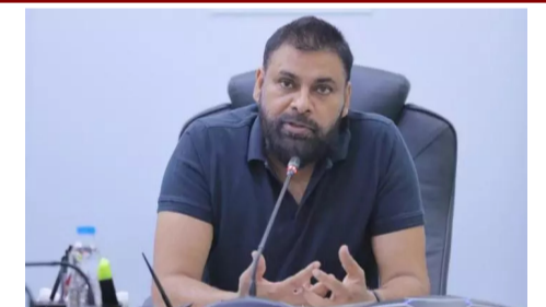
రాజకీయాల్లో విమర్శలు ఎదురైనప్పుడు సహనం కోల్పోకుండా, ప్రజాస్వామ్య పంథాలోనే సమాధానం చెప్పాలని ఏపీ డిప్యూటీ సీఎం పవన్ కల్యాణ్ పిలుపునిచ్చారు. దాడులు చేయడం పరిష్కారం కాదని, మిగతా 2లో

●రాజకీయాల్లో విమర్శలు ఎదురైనప్పుడు సహనం కోల్పోకుండా, ప్రజాస్వామ్య పంథాలోనే సమాధానం చెప్పాలని ఏపీ డిప్యూటీ సీఎం పవన్ కల్యాణ్ పిలుపునిచ్చారు. ●దాడులు చేయడం పరిష్కారం కాదని, అవసరమైతే న్యాయస్థానాల ద్వారా పోరాటం చేయాలని కూటమి శ్రేణులకు బిశానిర్దేశం చేశారు.