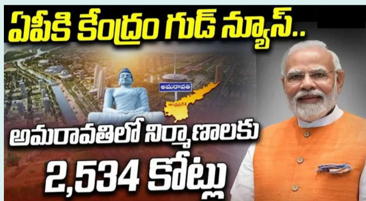
ఆంధ్రప్రదేశ్ కు కేంద్ర ప్రభుత్వం శుభవార్త చెప్పింది. రూ.2,534 కోట్లతో అమరావతిలో కేంద్రం భారీ నిర్మాణాలను చేపట్టనుంది. అమరావతిలో సెంట్రల్ సెక్యూరిటీస్ నిర్మాణంలో కీలక ముందడుగు పడింది. అమరావతిలో కామన్ సెంట్రల్ సెక్యూరిటీస్ నిర్మాణం కోసం రూ.1,299.08 కోట్లు, నివాస సముదాయాల నిర్మాణం కోసం రూ.1,234.91 కోట్లతో కూడిన పీఐఐ మొరొరాండం సిద్దమైంది. ఈ ప్రాజెక్టులు వేగంగా ముందుకు సాగాలంటే కేబినెట్ సెక్యూరిటీస్ సెక్యూరిటీస్ వద్ద పెండింగ్లో ఉన్న మిగతా 2లో

నిర్మాణాల కోసం భారీగా భూమి కేటాయింపు ఆంధ్రప్రదేశ్ కు కేంద్ర ప్రభుత్వం శుభవార్త చెప్పింది. రూ.2,534 కోట్లతో అమరావతిలో కేంద్రం భారీ నిర్మాణాలను చేపట్టనుంది. అమరావతిలో సెంట్రల్ సెక్యూరిటీస్ నిర్మాణంలో కీలక ముందడుగు పడింది. అమరావతిలో కామన్ సెంట్రల్ సెక్యూరిటీస్ నిర్మాణం కోసం రూ.1,299.08 కోట్లు, నివాస సముదాయాల నిర్మాణం కోసం రూ.1,234.91 కోట్లతో కూడిన పీఐఐ మొరొరాండం సిద్దమైంది.