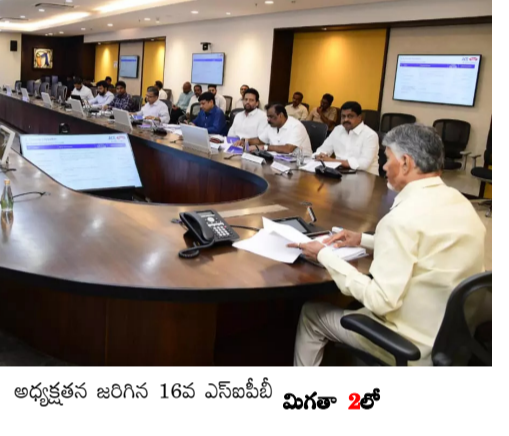
అధ్యక్షతన జరిగిన 16వ ఎస్ఐపీబీ మిగతా 2లో

ఆంధ్రప్రదేశ్ను పారిశ్రామిక ప్రగతి పథంలో పరుగులు పెట్టించే దిశగా ముఖ్యమంత్రి చంద్రబాబు ప్రభుత్వం కీలక నిర్ణయాలు తీసుకుంది. రాష్ట్రంలో వివిధ రంగాల్లో భారీ పెట్టుబడులకు మార్గం సుగమం చేస్తూ, రూ.39,436.84 కోట్ల విలువైన 31 ప్రాజెక్టులకు రాష్ట్రస్థాయి పెట్టుబడుల ప్రోత్సాహక బోర్డు (ఎస్ఐపీబీ) ఆమోదముద్ర వేసింది. ఈ ప్రాజెక్టుల ద్వారా రాష్ట్రంలో ప్రత్యేకంగా 1,11,278 మందికి ఉద్యోగ అవకాశాలు లభించనున్నాయి. మంగళవారం నాడు సచివాలయంలో ముఖ్యమంత్రి చంద్రబాబు