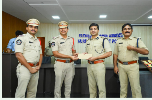
ఏర్పాటు చేశారు. దొంగతనానికి సంబంధించి ఇద్దరు నిందితులు.