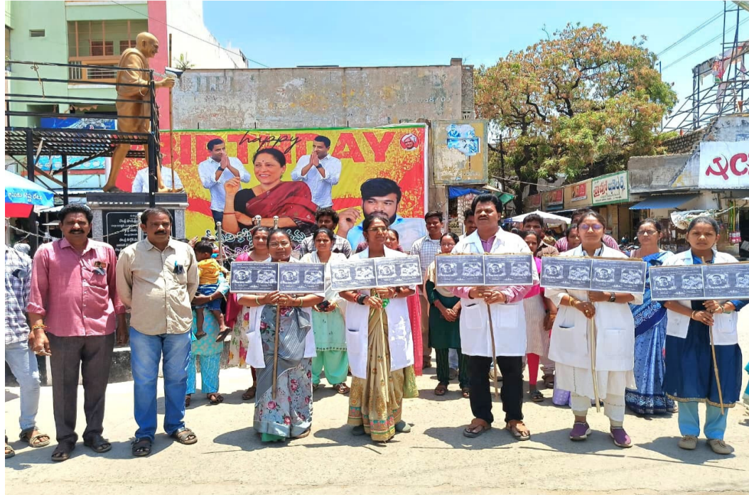
ఏప్రిల్ 6న బ్లాక్ బ్యాండ్ నిరసనకు బిలుపు. (డోన్ ప్రతినిధి ఏప్రిల్ 6 ( సీమ కిరణం న్యూస్ ) : డోన్