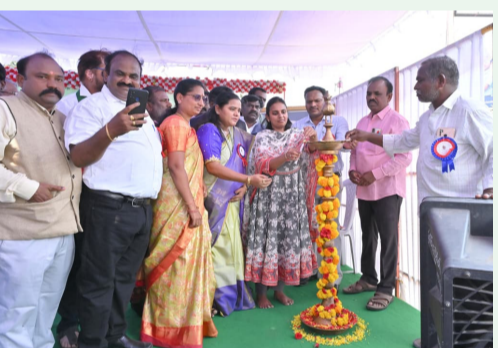
డా. బాబూ జగ్జీవన్ రాం సేవల భావితరాలకు స్ఫూర్తి దాయకం.