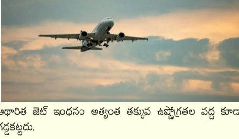
ఇథారిత్ జెట్ ఇంధనం అత్యంత తక్కువ ఉష్ణోగ్రతల వద్ద కూడా గడ్డకట్టదు.