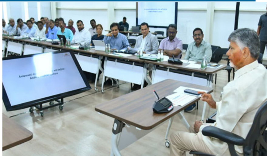
అమరావతి: అమరావతి రాజధాని నిర్మాణ పనులను వేగవంతం చేయాలని, నిర్మించిన గడువులోగా పూర్తి చేయాలని సీఎం చంద్రబాబు ఆధికారులను, నిర్మాణ సంస్థల ప్రతినిధులను ఆహ్వానించారు. ఈ విషయంలో రాజీ పడే ప్రసక్తి లేదని ఆయన స్పష్టం చేశారు. తాజావార్షికోని క్యాంప్ కార్యాలయంలో రాజధాని నిర్మాణ పనులపై మంత్రి నారాయణ, సీఆర్‌డీఏ, ఏడీసీ మిగతా..26