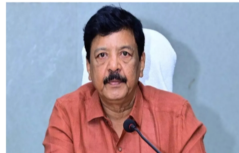
కొత్త ఆర్థిక సంవత్సరం ప్రారంభం వేళ ఆంధ్రప్రదేశ్ పర్యాటక రంగాన్ని అంతర్జాతీయ స్థాయికి తీసుకెళ్లే లక్ష్యంతో రాష్ట్ర పర్యాటక, సాంస్కృతిక శాఖ మంత్రివర్యులు మిగతా 2లో