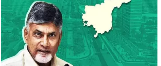
ఇక అజేయం.. అజరామరం" అని అన్నారు. రాజధాని ప్రపంచంలో నిలిపేలా విశ్వసనీయంగా తీర్చిదిద్దడామని ఆయన పునరుద్ఘాటించారు. మిగతా 2లో

స్వర్ణాంధ్ర నిర్మాణంలో ఇది ఒక కీలక మైలురాయి ఆంధ్రప్రదేశ్ ఏకైక రాజధానిగా అమరావతికి చట్టబద్ధత కల్పిస్తూ లోక్ సభలో బిల్లు ఆమోదం పొందడంపై ముఖ్యమంత్రి చంద్రబాబు హర్షం వ్యక్తం చేశారు. ఇది ఆంధ్రుల ఆత్మగౌరవానికి, ప్రజల ఆకాంక్షలకు లభించిన గౌరవమని ఆయన అభివర్ణించారు. ఈ చారిత్రాత్మక పరిణామంతో రాజధాని భవిష్యత్తుపై నెలకొన్న సందిగ్ధతకు శాశ్వతంగా తెరపడిందని స్పష్టం చేశారు. ఈ సందర్భంగా సీఎం చంద్రబాబు స్పందిస్తూ, "గత ప్రభుత్వ పాలనలో ఎదురైన చీకట్లు తొలగిపోయాయి. ప్రజా రాజధాని అమరావతి ఆంధ్రుల ఆత్మగౌరవానికి ప్రతీక. రైతుల త్యాగానికి దక్షిణ గౌరవం ఇది. స్వర్ణాంధ్ర నిర్మాణంలో ఇది ఒక కీలక మైలురాయి. అమరావతి