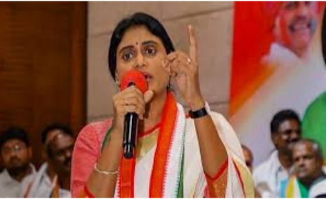
ఆంధ్రప్రదేశ్ ఎంపీలపై ఏపీ కాంగ్రెస్ అధ్యక్షురాలు వైఎస్ షర్మిల తీవ్రస్థాయిలో విరుచుకుపడ్డారు. రాష్ట్రానికి జీవన్మరణ సమస్య అయిన ప్రత్యేక హోదా, విభజన హామీల సాధనలో ఎంపీలు పూర్తిగా విఫలమయ్యారని, వారు ప్రధాని మోదీ చేతిలో కీలుబొమ్మలుగా, బీజేపీకి బానిసలుగా మారారని ఆమె తీవ్రంగా ఆరోపించారు. రాష్ట్ర ప్రయోజనాలను మిగతా 2లో

"మన ఎంపీలకు స్వలాభం మిన్న, రాష్ట్ర ప్రయోజనాలు సున్నా" ● ఆంధ్రప్రదేశ్ ఎంపీలపై ఏపీ కాంగ్రెస్ అధ్యక్షురాలు వైఎస్ షర్మిల తీవ్రస్థాయిలో విరుచుకుపడ్డారు. ● రాష్ట్రానికి జీవన్మరణ సమస్య అయిన ప్రత్యేక హోదా, విభజన హామీల సాధనలో ఎంపీలు పూర్తిగా విఫలమయ్యారని, వారు ప్రధాని మోదీ చేతిలో కీలుబొమ్మలుగా, బీజేపీకి బానిసలుగా మారారని ఆమె తీవ్రంగా ఆరోపించారు.